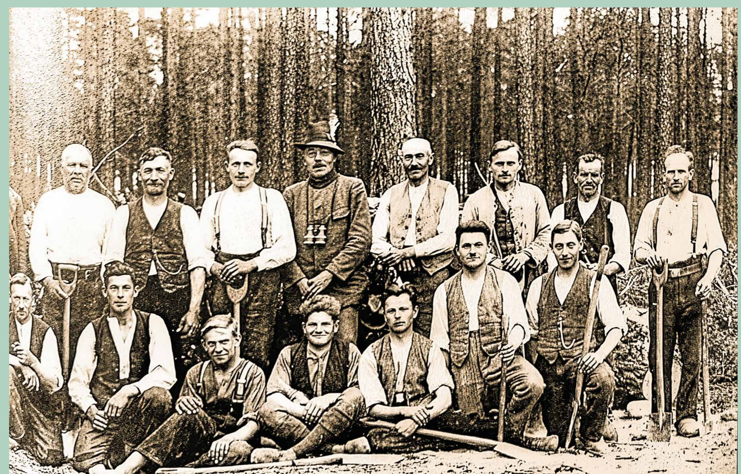
Waldarbeitertrupp im Revier Trebitz, 1930er Jahre