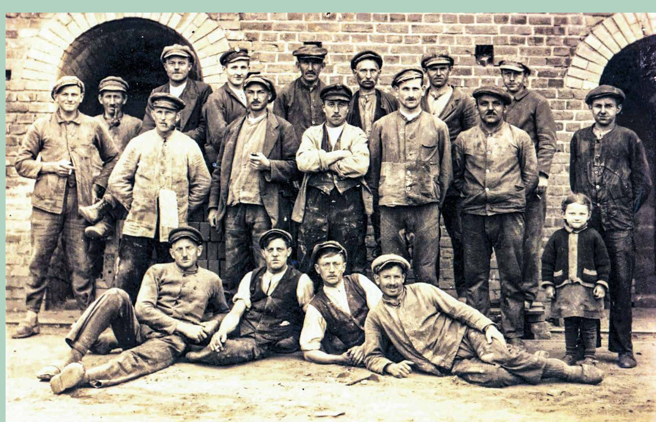
Ziegelearbeiter 1930er Jahre

In jedem der sieben Forstreviere des Waldgutes, in Liebitz, Hollbrunn, Jamlitz, Staakow, Pinnow, Trebitz und Damme, waren jeweils 60 Waldarbeiter sowie ein Revierförster und ein Hilfsrevierförster beschäftigt. Ein Forstmeister war für die Verwaltung des gesamten Waldgutes zuständig, dazu noch mit der Bewirtschaftung der Samendarre am Schloss und dem Sägewerk. Im Winterhalbjahr, wenn das Holz geschlagen wurde, war der Graf der größte Arbeitgeber.