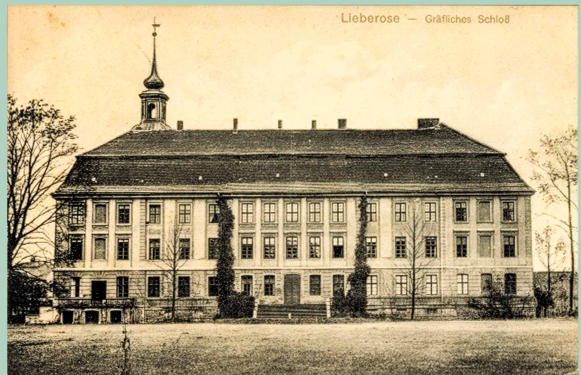
Das Schulenburg'sche Schloss in Lieberose. Seit 1930 Sitz des Waldgutes. Postkarte aus den 1930er Jahren

Das 1929 als Stiftung gegründete „Graf von der Schulenburg'sche Waldgut“ bestand aus einer Forstfläche von 10.837 Hektar und einer landwirtschaftlich genutzten Fläche von 1.685 Hektar. Nachdem der Schwieloch- und der Mochowsee verkauft waren, das Gut Lamsfeld abgetreten war, wurden 1929 die bestehenden Gutsbezirke Lieberose-Schloss, Jamlitz, Mochlitz und Trebitz aufgelöst. Der verbleibende Rest dieser Gutsbezirke wurde als Forstgutsbezirk „Lieberoser Heide“ aufrechterhalten.