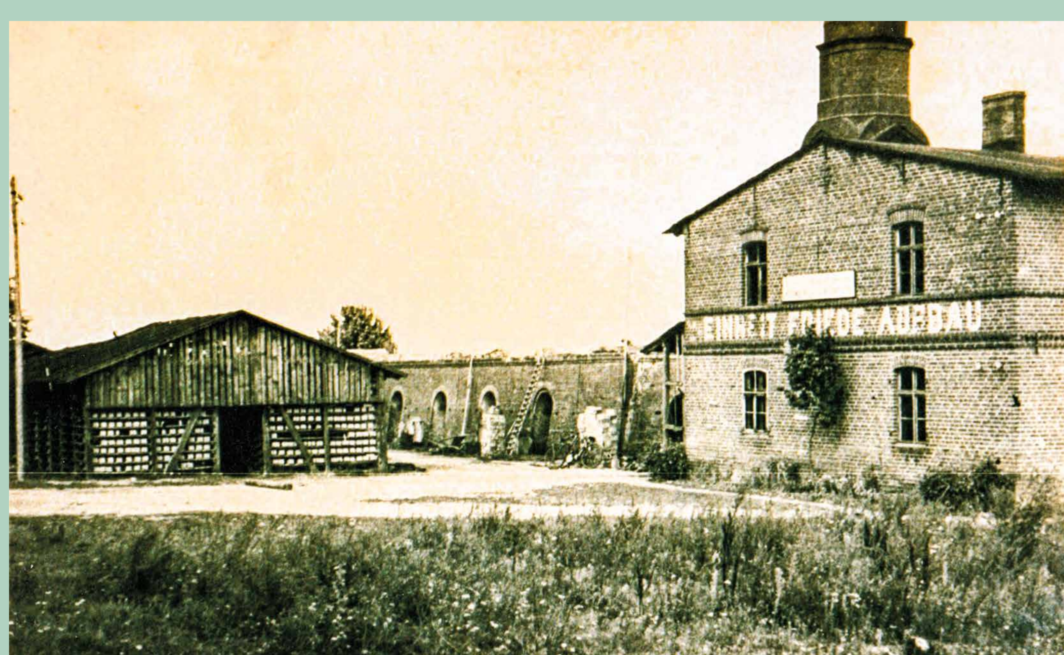
Dampfziegelei Lieberose, 1950er Jahre