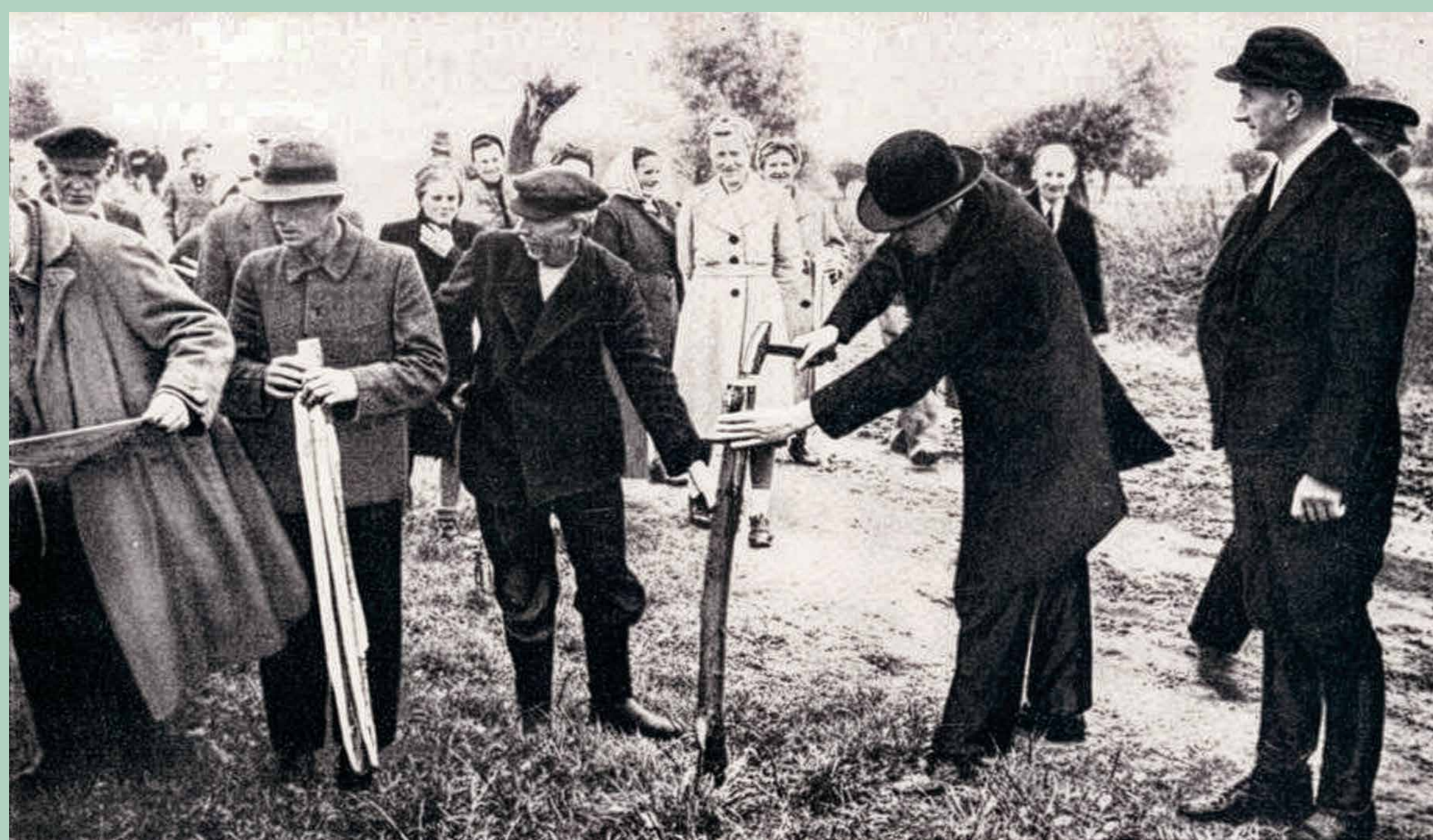
„Junkerland in Bauernhand“, Symbolbild

1943 erfolgte eine teilweise Enteignung des Schulenburg'schen Waldbesitzes durch die Waffen-SS, die nach einem verheerenden Waldbrand für die Erweiterung des Truppenübungsplatzes „Kurmark“ enormen Raumbedarf hatte.