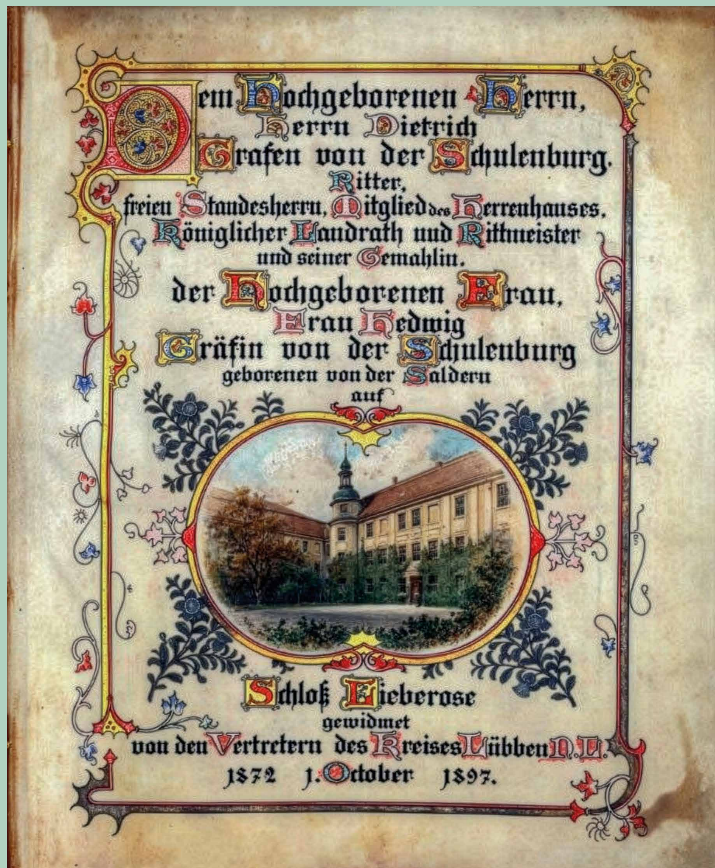
Glückwünsche der Vertreter des Kreises Lützen zur Silberhochzeit des Grafen Dietrich von der Schulenburg im Jahr 1897

Im Glückwunschsreiben der Vertreter des Kreises Lützen zur Silberhochzeit des Grafen Dietrich von der Schulenburg ist noch artig von dem Hochgeborenen Herrn und königlichen Landrat (1887-1899) im Landkreis Lützen die Rede. Nach 1918 beschleunigte die Novemberrevolution und die Weimarer Republik den Niedergang des Adels. Nachdem die verfassunggebende preußische Landesversammlung am 23. Juni 1920 das Preußische Gesetz über die Aufhebung der Standesvorrechte des Adels und die Auflösung des Hausvermögens beschlossen hatte, verloren auch die Grafen von der Schulenburg ihre Privilegien. Zu alledem verloren sie im Jahr 1929 ihren Gutsbezirk, den Otto von der Schulenburg in ein Waldgut umwandelte.