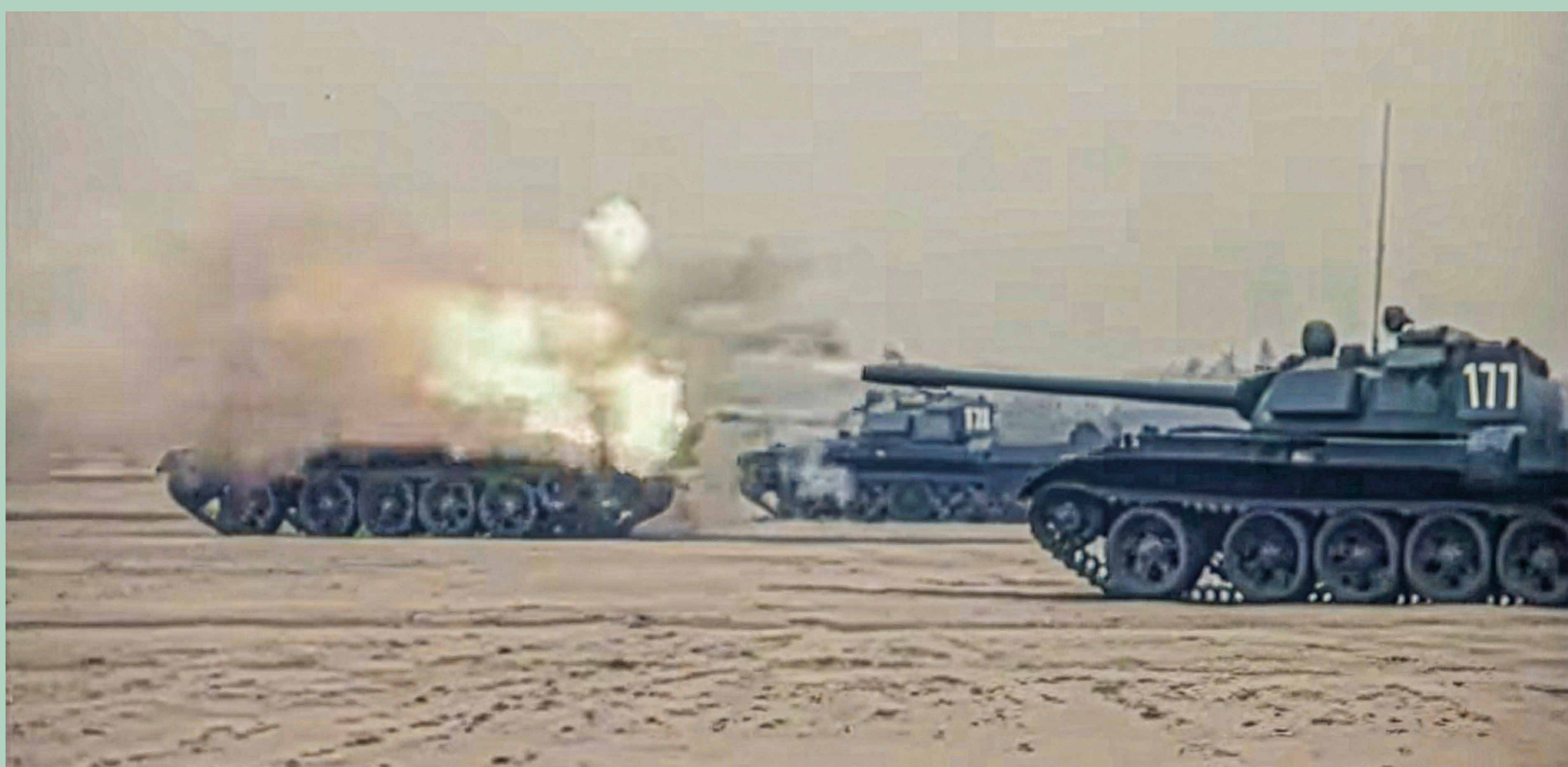
Simulierte Kampfhandlungen, Filmaufnahme aus Manöver Waffenbrüderschaft 1970, Defa Dokumentarfilmstudio

Unter dem Motto Klassenbrüder – Waffenbrüder wollte die DDR-Führung erstmalig alle Bündnisarmeen des sozialistischen Lagers in einem Manöver vereinigen, um dem sogenannten Klassenfeind Stärke und Zusammenhalt zu demonstrieren. Nicht nur Gefechtsbereitschaft, Beherrschung moderner Waffensysteme sowie sozialistische Truppenführung galt es zu beweisen, sondern auf ideologischer Ebene die Freundschaft und Waffenbrüderschaft zu untermauern. An dem Manöver, das sich über mehrere Bezirke der DDR erstreckte, waren über 73.000 Soldaten und Offiziere beteiligt. An militärischem Gerät kamen 3.250 Objekte zum Einsatz, darunter rund 850 Panzer, 500 Geschütze sowie Flugzeuge, Hubschrauber und Schiffe.